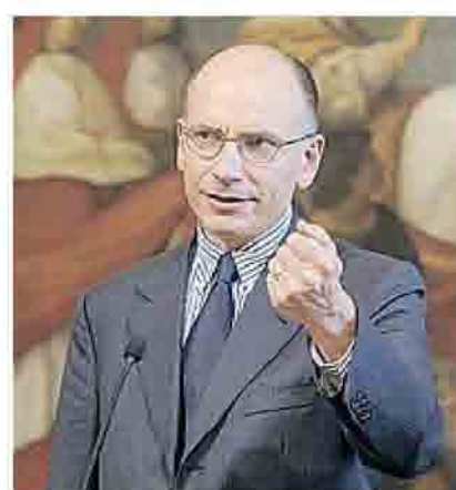
Il presidente del consiglio Letta al giuramento dei sottosegretari

Convenzione riforme: veto su Berlusconi Pd e Pdl si azzuffano Letta avverte i suoi «Niente liti»